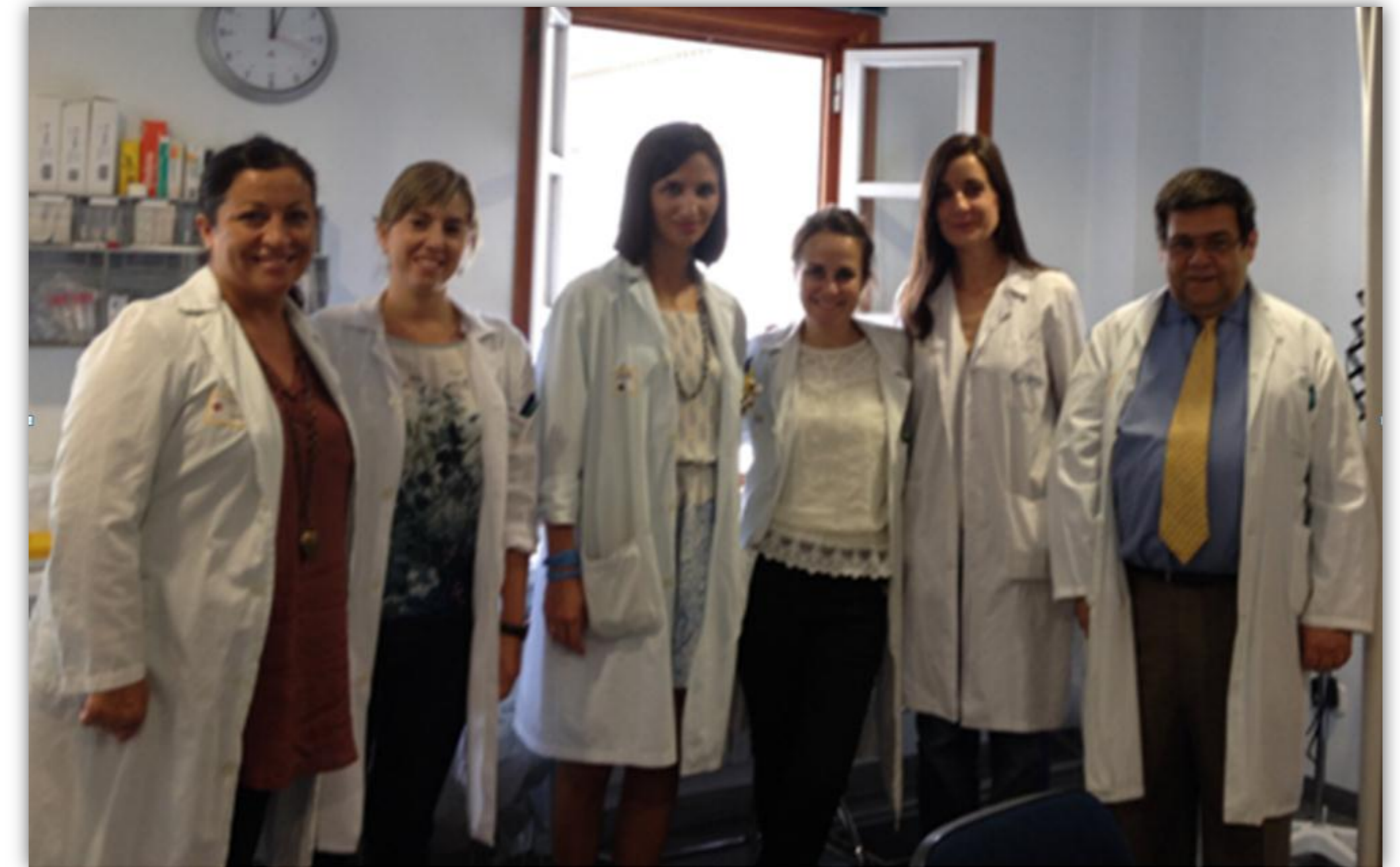
Equipo multidisciplinar de la consulta externa de terapias biológicas en Dermatología.